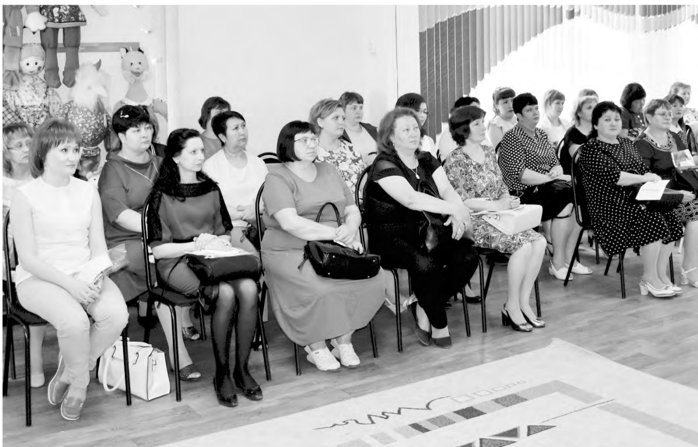
Секция в детском саду №145 собрала профлидеров дошкольных учреждений

- Я впервые на слете. Приятно проникнуться этой атмосферой, узнать о работе своих коллег по «профсоюзному цеху». Профсоюзный актив - это интересные, яркие люди, общение с которыми доставляет истинное удовольствие. На своей работе я организую туристско-краеведческую деятельность, занимаюсь спортивным туризмом, готовлю детей к соревнованиям, слетам. Коллектив у нас небольшой - всего восемь основных работников плюс совместители. Все состоят в профсоюзе. Я считаю, что без этой организации сегодня никуда - и в радости и горе профсоюз всегда рядом.