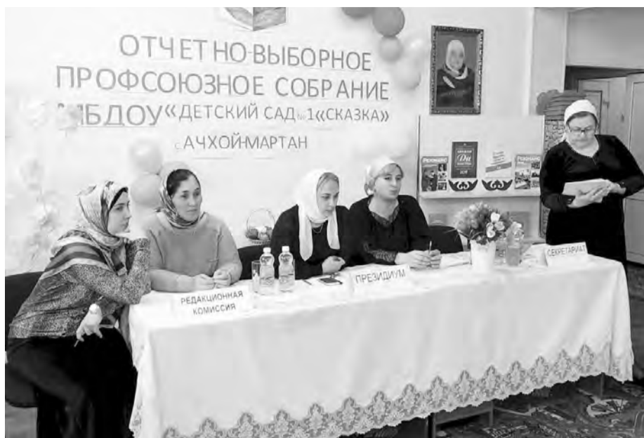
В детском саду №1 «Сказка» села Ачхой-Мартан

Наша газета в этом году уже подробно рассказывала об уникальной структуре управления, которая создана в Чеченской республиканской организации профсоюза. Напомним, что она включает в себя республиканский совет, уполномоченных в округах, представителей рессвета в районах, кураторов первичных организаций в районах, председателей и уполномоченных первичных организаций. В соответствии с решением президиума республиканского совета профсоюза отчетно-выборные собрания в первичных организациях были проведены с 1 марта по 1 апреля текущего года. Такие сроки были установлены для минимального отрыва педагогов от работы и максимального использования каникулярного времени.