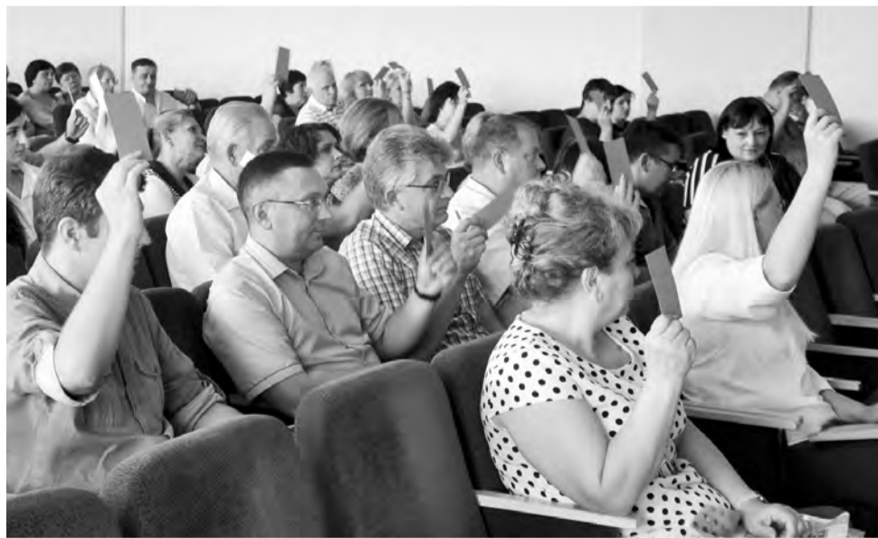
Голосование на отчетно-выборной профсоюзной конференции ВГУИТ

ностным окладам. С 1 мая этого года оклад учебно-вспомогательного персонала увеличен до минимального размера оплаты труда. Средняя зарплата профессорско-преподавательского состава держится на уровне, заданном президентским указом - 200% от средней заработной платы по региону.