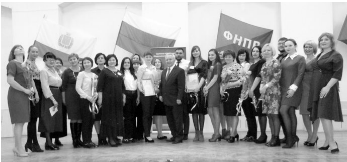
Участники конкурса «Лидер в профсоюзе»-2019

Областной конкурс «Лидер в профсоюзе» - ровесник нашего молодого века. В 2019 году он прошел в Саратове в 19-й раз. На заключительные испытания из разных уголков области съехались 14 председателей первичных профсоюзных организаций учреждений образования. После тестирования и научно-практической конференции определилась шестерка суперфиналистов. На праздничном вечере в актовом зале областного Дома профсоюзов они представили яркие презентации.