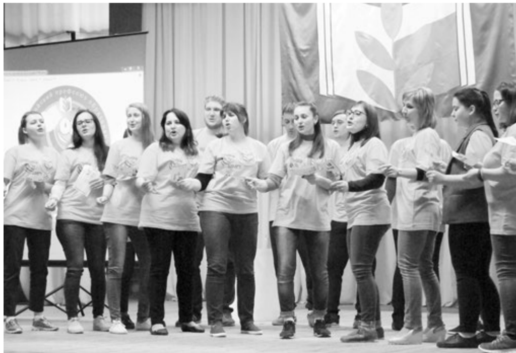
Команда «оранжевых» исполняет свою зажигательную песню