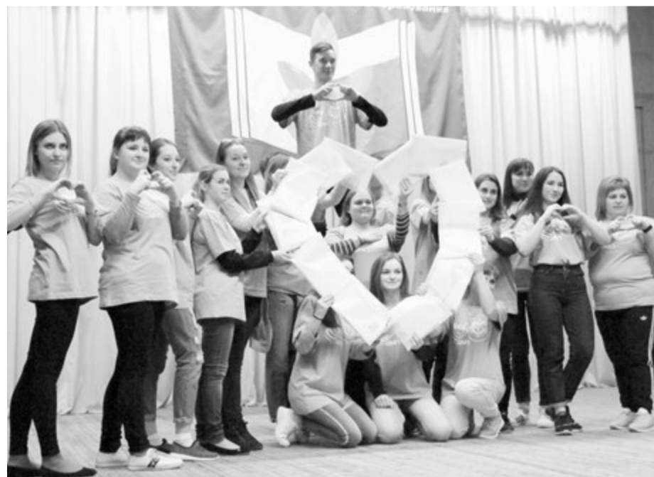
Команда «бирюзовых» показывает химический элемент аурум и золотое сердце учителя

Третье - римская единица, которая указывает не только на то, что это команда номер один, но и на первый элемент в таблице Менделеева - водород, без которого так же, как и без учителя, жизнь на земле невозможна. А последнее фото - улыбка, символизирующая гелий и кальций, без красивой улыбки учителю не обойтись. После ухода команды со сцены зал угадывает главное