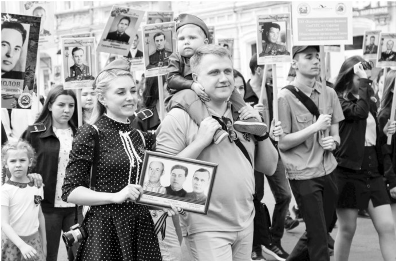
Бессмертный полк в Саратове