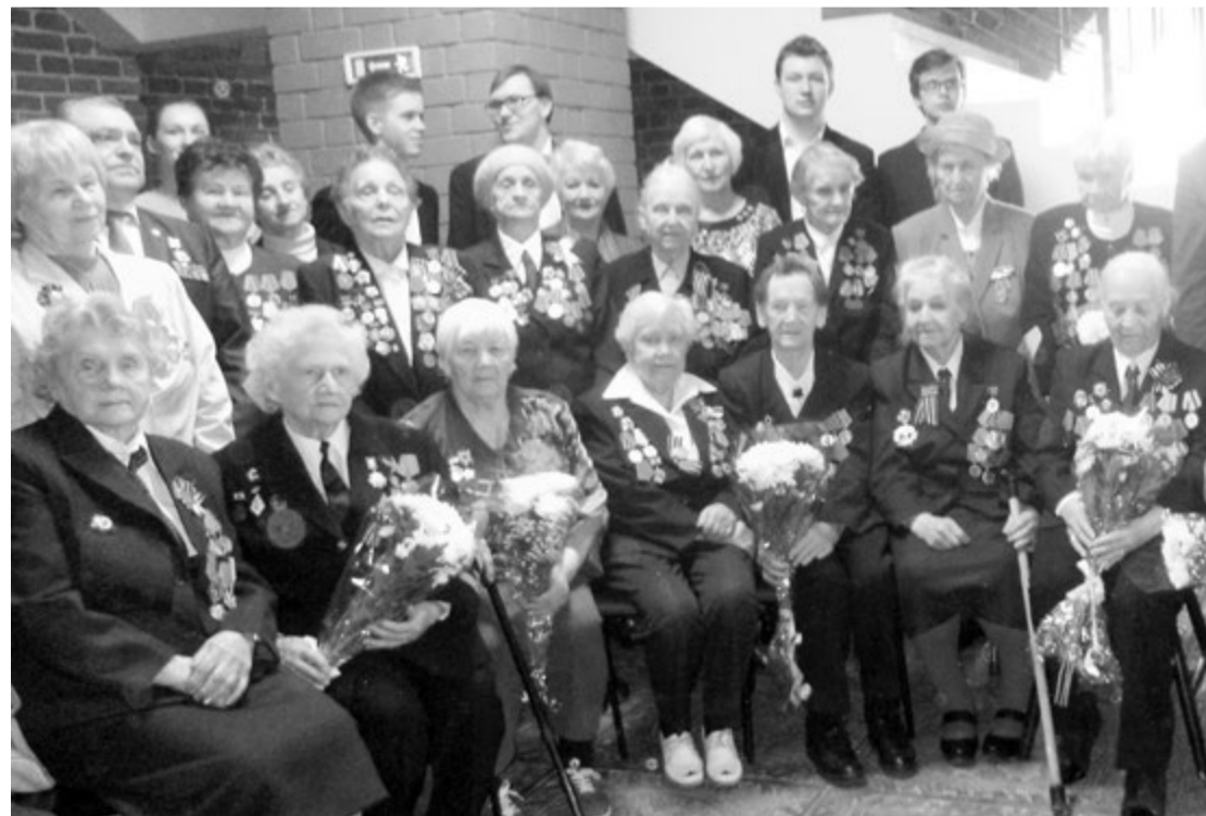
На встречу с молодым поколением пришли фронтовики

к какому-то заросшему болоту, утомленные солдаты бросились к воде, процеживали ее через пилотки. И только напившись, заметили невдалеке плавающий труп фашиста».