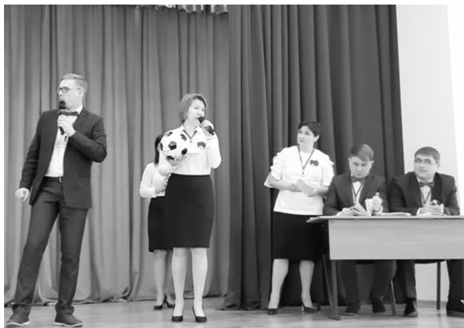
Мастер-класс клуба «Учитель года Тульской области»