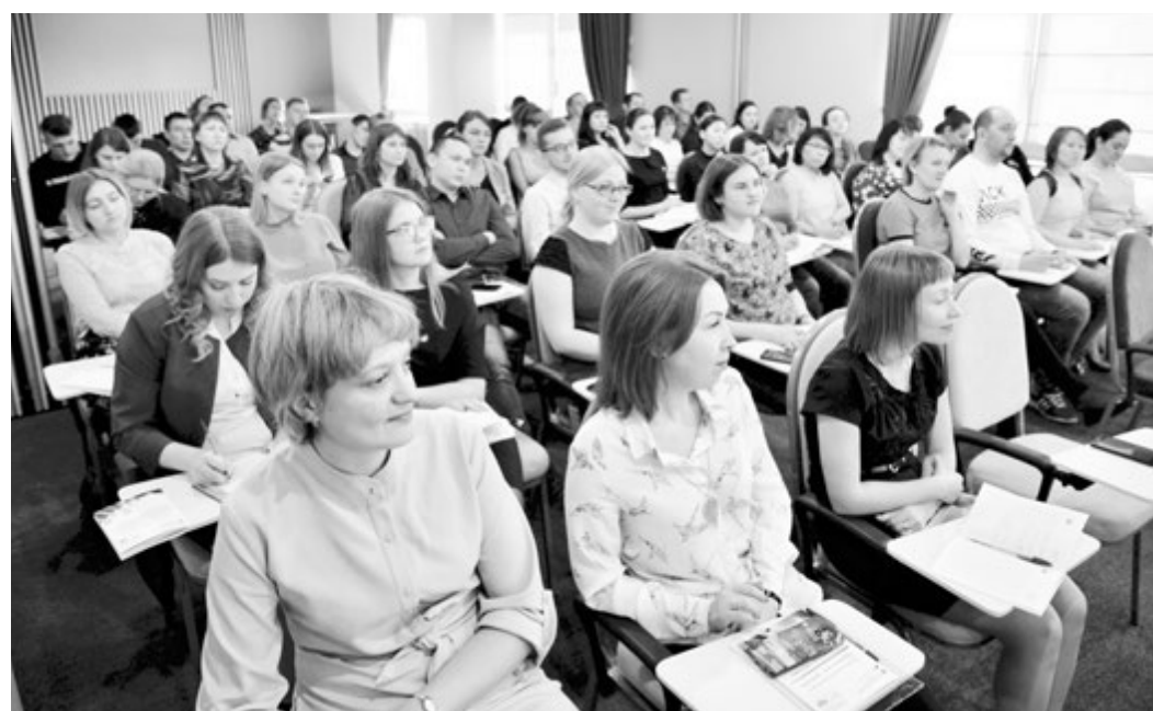
Молодые педагоги Тюменской области

Мавладиевич, выпускник Северо-Западной академии госслужбы, - хотя недостаток профильной подготовки я время от времени ощущаю... Вместе с тем много раз приходилось видеть молодых специалистов, которые непонятно чему учились в педагогических вузах. Так может, не надо спорить, нужен ли нам вузовский диплом или достаточно окончить курсы, а задуматься о том, как именно должна преподаваться педагогика, как эффективнее обучать тех, кто готовится прийти в класс?»