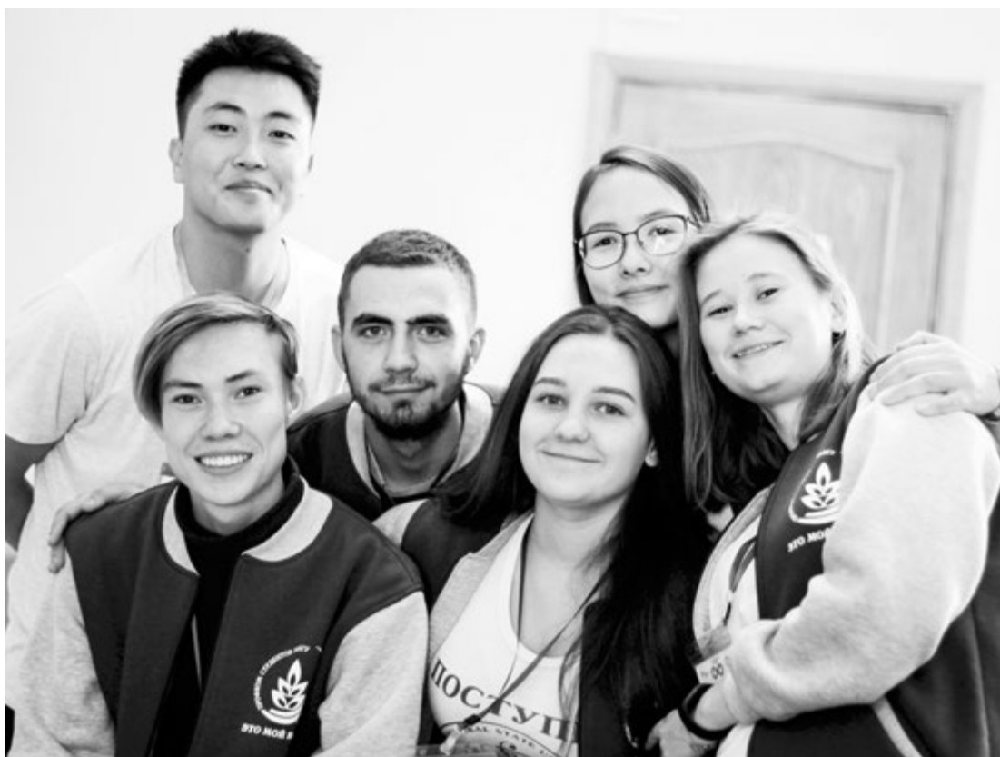
Члены нового профкома ЗабГУ

Прим. ред. Материал публикуется в рамках конкурса «Профсоюзный репортер».