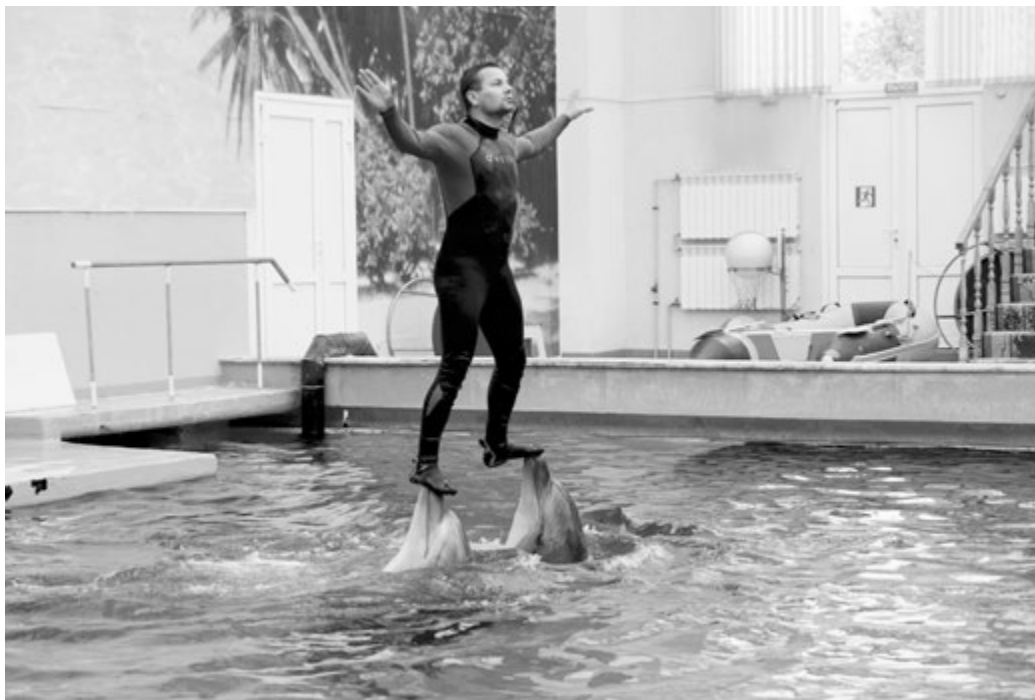
Представление в дельфинарии