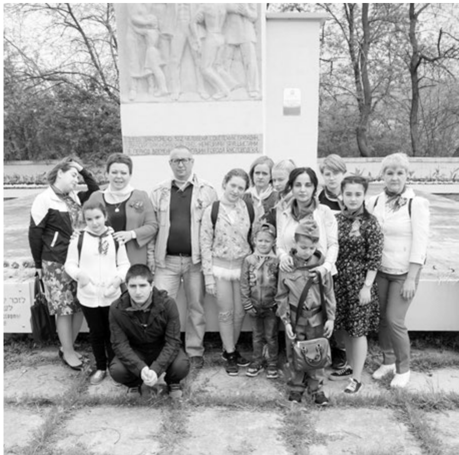
У мемориала Воинской славы