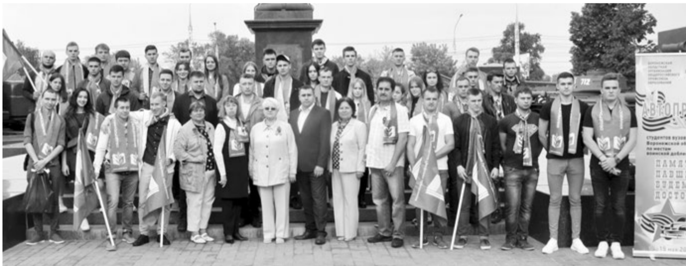
Возле стелы «Город воинской славы» в Воронеже

Полную версию репортажа читайте на сайте Vobkom.ru .