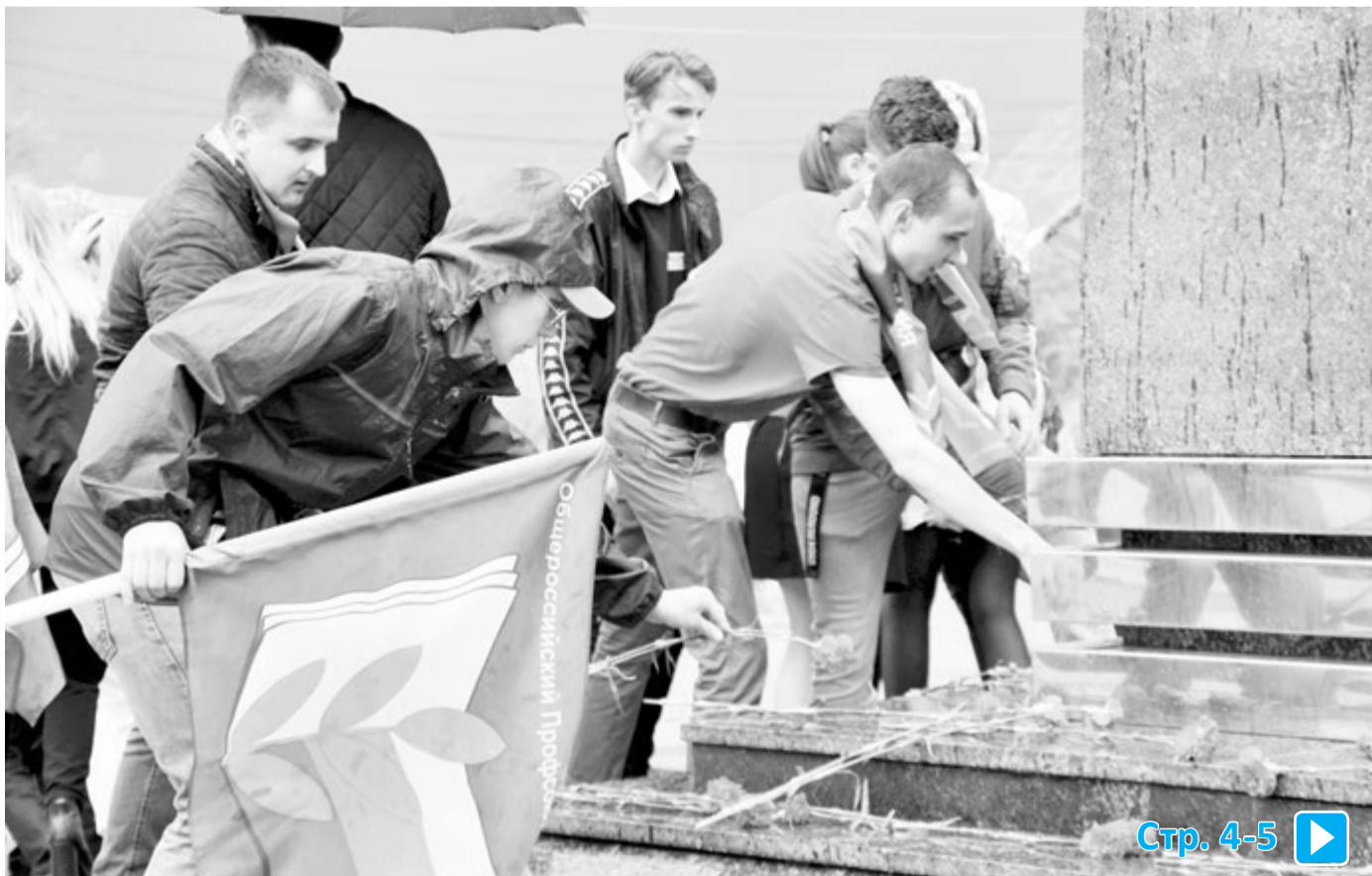
Участники автопробега в Россоши

Под таким девизом состоялся автопробег студенческого профактива воронежских вузов, приуроченный к Дню Победы и столетию студенческого профсоюзного движения