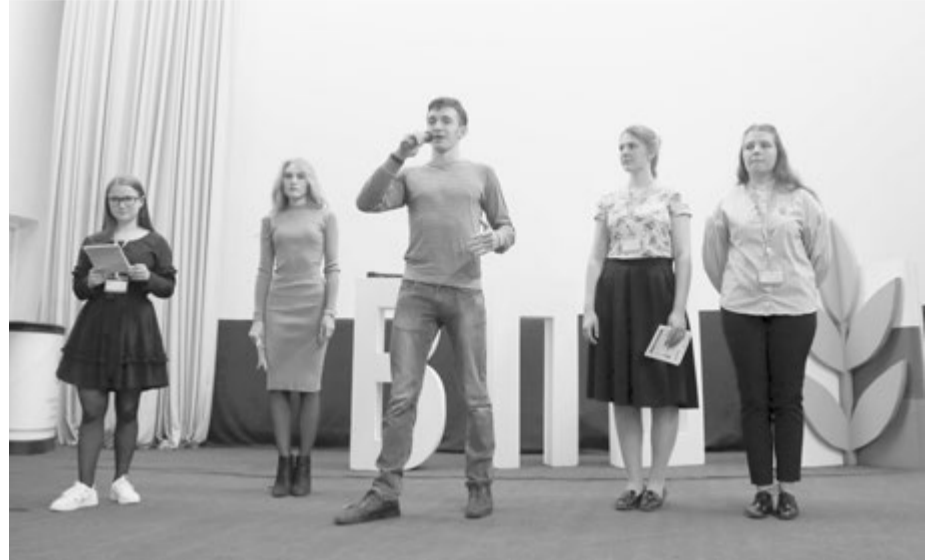
Об учителе будущего рассказывают победители Российской психолого-педагогической олимпиады школьников

«Я уверена, что деятельность учителя не должна ограничиваться преподаванием. У педагога должны быть интересы вне школы: занятия спортом, шитье, граффити, коллекционирование монет, игра на музыкальных инструментах или путешествия... Учитель играет важную роль в раскрытии и формировании личности ребенка. Не пробуя себя в