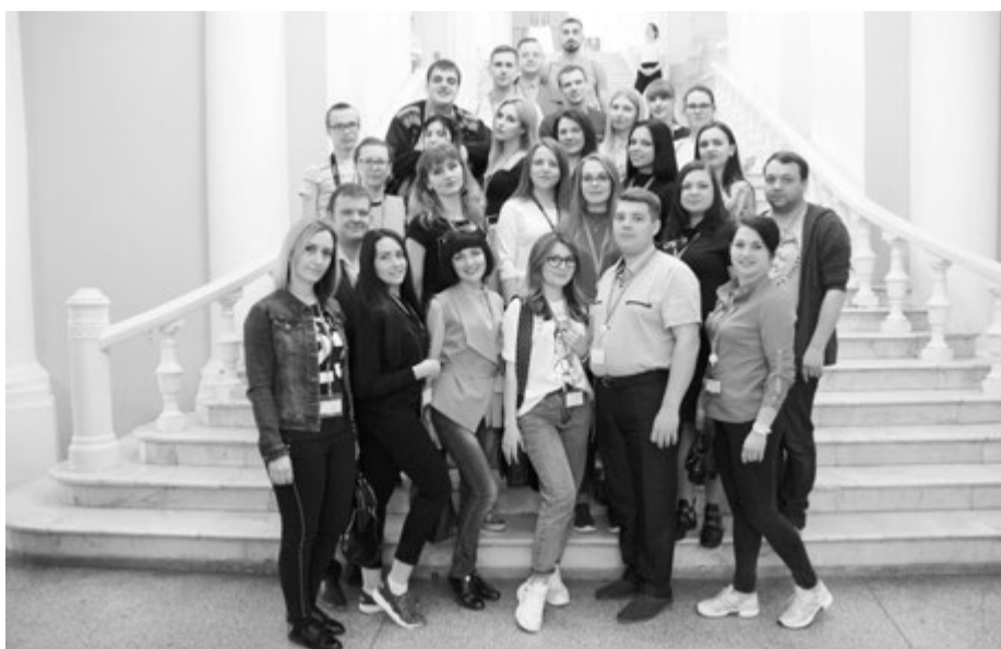
На лестнице РАМТа