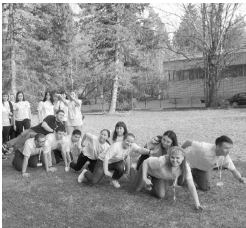
Команда «Белые ходоки»