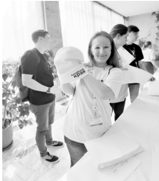
Участники ВПШ профсоюза Традиционный обмен подарками