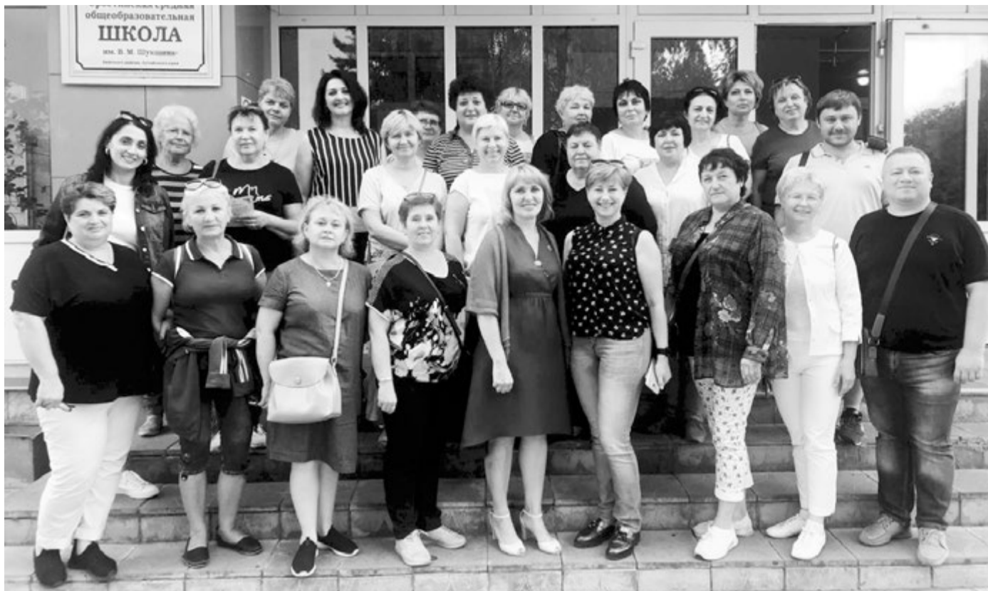
В Сростинской школе

Первой их встретила средняя школа №53 - лучшая в крае по организации патриотического воспитания. Об этом свидетельствуют не только инновационные программы, по-