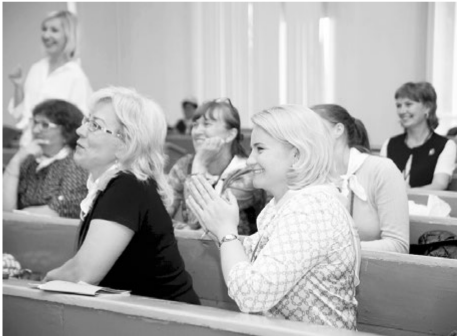
На фестивале не было ни одного скучного мастер-класса

Трудно назвать аспект школьной жизни, которому бы не было уделено внимание на