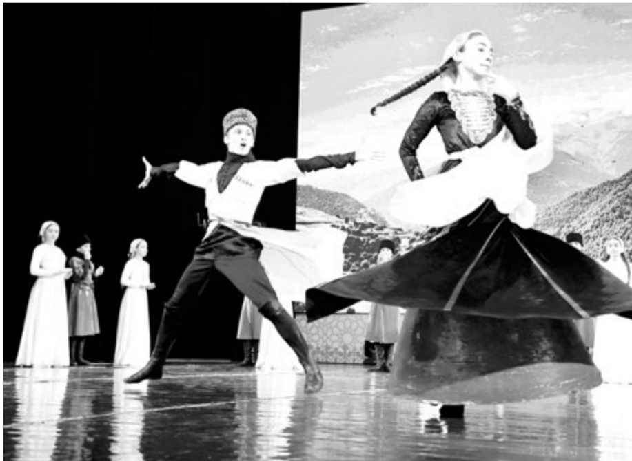
Таланты чеченской земли