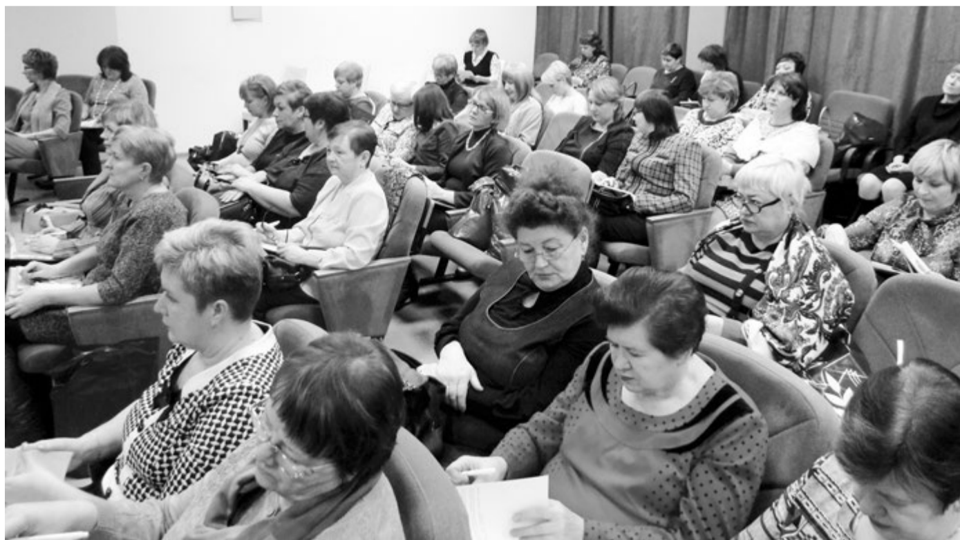
На пленарном заседании

Пресс-центр Нижегородской областной организации Профсоюза работников народного образования и науки РФ