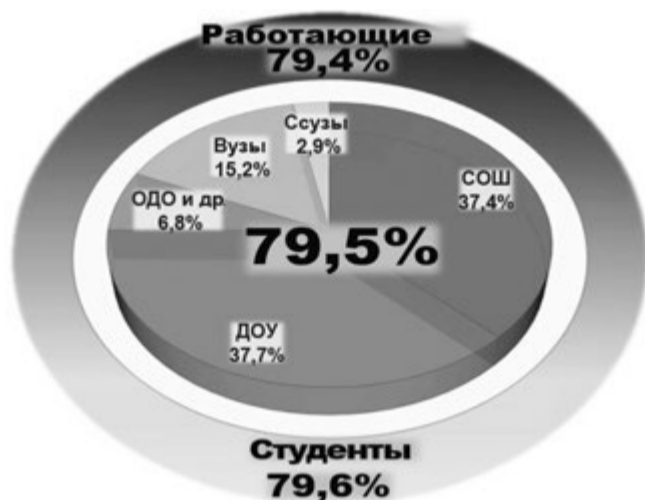
Охват профсоюзным членством в образовательных организациях Нижегородской области

рождения, обучения студенческого актива за счет отчислений вузов в соответствии с заключенными соглашениями накопили первичные профсоюзные организации ННГУ им. Н.И.Лобачевского и Нижегородского государственного архитектурно-строительного университета (ННГАСУ). За 2017 год студенческая первичка ННГУ получила от вуза на организацию работы со студентами 21514074 рубля, а профсоюзная организация ННГАСУ - 1829300 рублей.