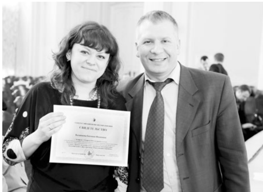
Все участники семинара получили свидетельства

ков. Надо найти какой-то гибкий подход, чтобы учитывать все возможные ситуации, которые могут возникать в нашей деятельности.