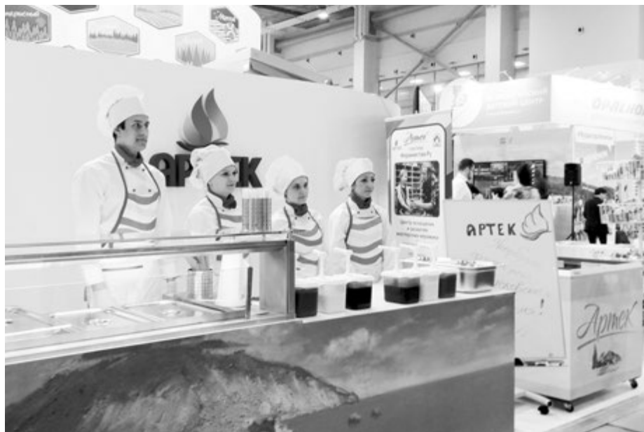
На стенде «Артека» всех угощали вкусными блинчиками

лагерем - и органами исполнительной власти. В Новосибирской области такой союз возник. И благодаря этому была открыта магистерская программа «Менеджмент в сфере детского отдыха и оздоровления». «Это первая основная образовательная программа в истории отечественного образования, направленная на подготовку кадров в этой сфере. Мы работаем на общие задачи - обеспечение кадрами сферы детского отдыха и развитие этой сферы, проведение научных исследований, обеспечение научно-методического сопровождения организации детского отдыха. Таким образом, в