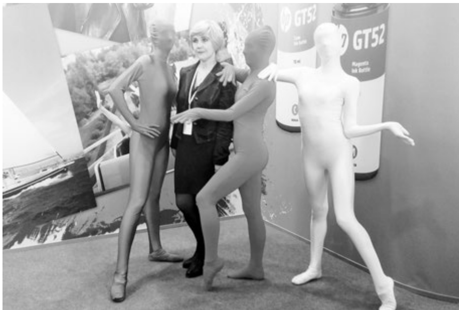
Радуга идей в конкретном воплощении