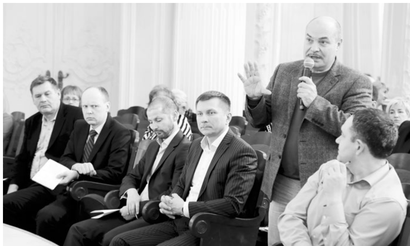
Обсуждение проекта устава