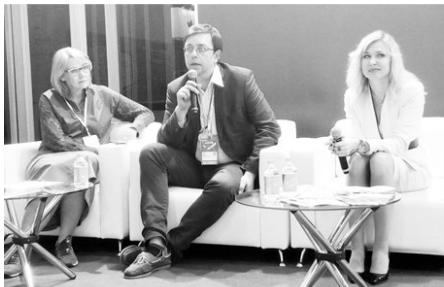
Совместный проект представляют «Артек» и Новосибирская область

Состоялся первый большой проект клуба - республиканский семинар «Формула образования», он собрал около 200 участников конкурса «Учитель года» из различных муниципалитетов республики. Участники семинара дали десять мастер-классов, шесть открытых уроков, прошли индивидуальные консультации от победителей и лауреатов