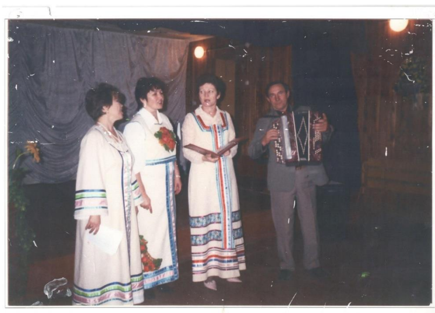
Родилась с селе Перепловенка Безенчукского района.